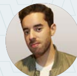
Sébastien Doze Photographe & auteur culinaire