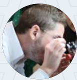
Cornell Mallard Négociant pierres de couleur Garaude